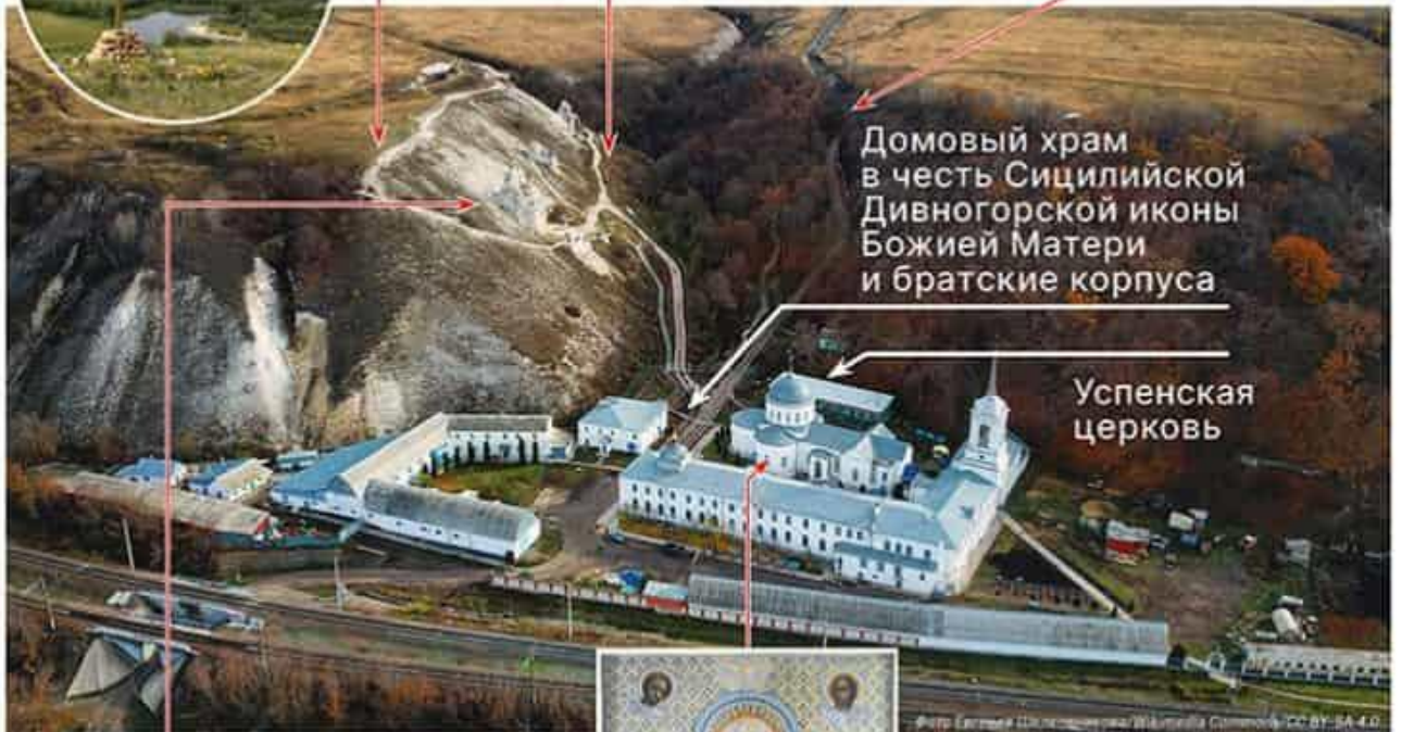
Домовый храм в честь Сицилийской Дивногорской иконы Божией Матери и братские корпуса